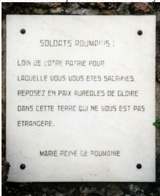
Labrz - Lorena - Placă dedicată de Regina Maria

În 1991, în numele Ambasadei Române din Paris, împreună cu o delegație a Ministerului Apărării și în prezența autorităților militare franceze, s-a depus la cimitirele din Soultzmat, Haguenau și Dieuze câte o placă comemorativă bilingvă cu următorul text: „ În memoria celor 2344 prizonieri de război morți în lagărele germane din Alsacia și Lorena în anii 1917 și 1918; în memoria alsacienilor și lorenilor care i-au ajutat să supraviețuiască ”.