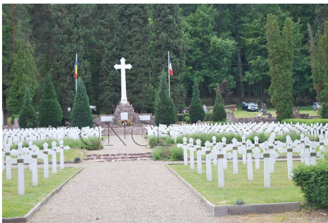
Cimitirul ostașilor români din Soultzmatt - Alsacia

După ce au căzut prizonieri, ostașii români au fost transportați în vagoane de vite, în condiții cumplite de frig, malnutriție și lipsă totală de igienă, în Germania, unde au fost repartizați în lagăre de muncă. Peste 2000 dintre aceștia au fost, apoi, internați în tabere de muncă situate în Alsacia și Lorena, care s-au dovedit a fi, în final, adevărate lagăre ale morții. Astfel, 2344 de prizonieri români au decedat în perioada ianuarie 1917 –decembrie 1918, dintre care 1180 în Alsacia și 1164 în Lorena. Au murit de frig, de foame, din cauza muncii istovitoare și lipsei totale a unei minime asistențe medicale. Un factor care a contribuit în mod hotărâtor la aceste dispariții masive a fost faptul că în iarna 1916-1917 s-au înregistrat lungi perioade cu temperaturi negative, în jurul valorii de minus 20 grade C.