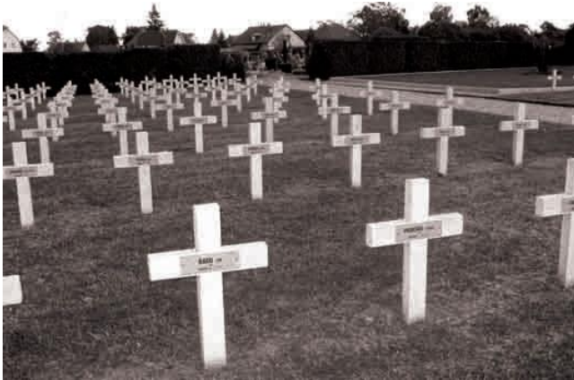
Cimitirul ostașilor români din Haguenau - Alsacia

În 1991, în numele Ambasadei Române din Paris, împreună cu o delegație a Ministerului Apărării și în prezența autorităților militare franceze, s-a depus la cimitirele din Soultzmat, Haguenau și Dieuze câte o placă comemorativă bilingvă cu următorul text: „ În memoria celor 2344 prizonieri de război morți în lagărele germane din Alsacia și Lorena în anii 1917 și 1918; în memoria alsacienilor și lorenilor care i-au ajutat să supraviețuiască ”.